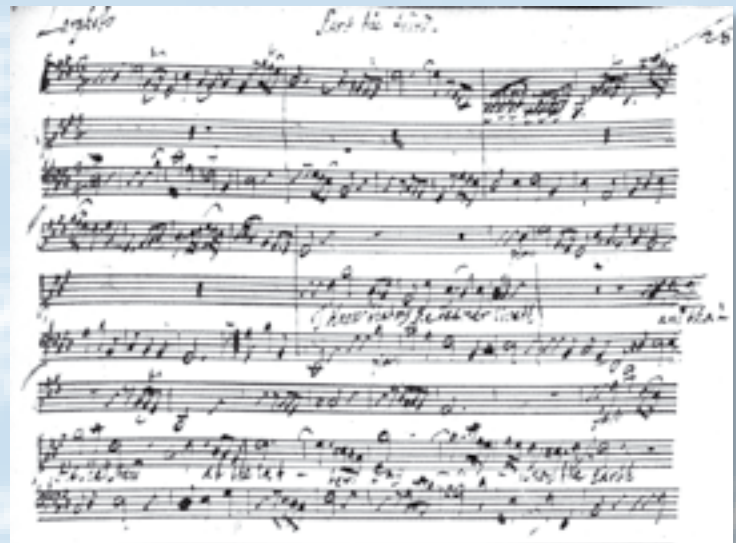
The begin of "I know that my Redeemer liveth" in Handel's manuscript

As a real cosmopolitan, Handel's style is rather eclectic in comparison with that of his contemporaries.