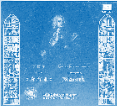
A Chinese CD with the "Messiah" (conductor: Wen-xing Su)