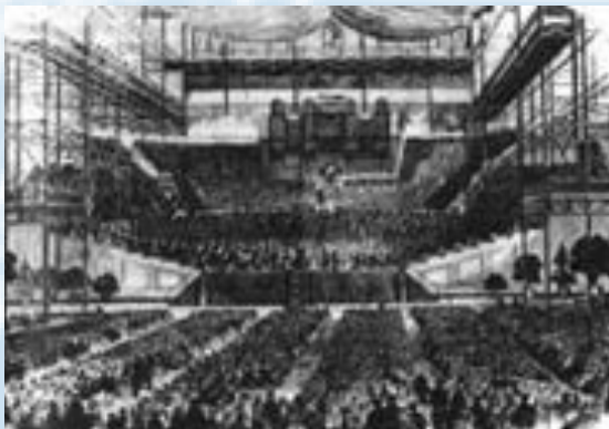
The big Handel Festival in the crystal palace in London 1859 with 2765 singers and 460 musicians

Handel's „Messiah“ is one of the most ambitious summaries of the whole baroque era. It arrived in 1741, when in the history of music new winds began to blow.