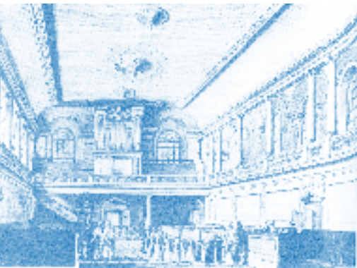
With the income of “Messiah” performances (taking place in this chapel) Handel supported from 1750 on the Thomas Coram’s “Foundling Hospital”.