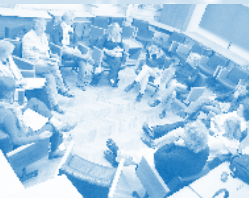
In den abendlichen Kleingruppen so wie in den morgendlichen „Chapel-Services“ ging es um die Botschaft von Händels „Messias“.

rock-klassizistische Stadt, zudem die Hauptstadt einer aufstrebenden Weltmacht, von aufgeklärter Aristokratie und starkem Mittelstand geprägt. Diese Klassen identifizierten sich mit dem Volk, das in den Chorälen des Oratoriums auftauchte, zum Beispiel mit den Juden, die sich ihren Weg zum verheissenen Land bahnten und sich die Unabhängigkeit erstritten („Judas Maccabäus,“) - so wie sich der Protestantismus in England gegen die Ansprüche Roms durchsetzte. Sie liebten die breiten Arien, in denen kein Hauch von Zweifel wehte und die glorreichen, marsch-ähnlichen Choräle, - den insgesamt triumphalistischen Charakter der Händelschen Musik.