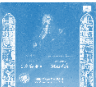
In China fanden unter der Leitung von Wenxing Su mehrere „Messias“-Aufführungen statt. Hier das Cover einer CD