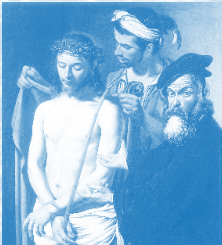
Both, Handel and the painter Caravaggio like sharp contrasts

To conclude we can say that Handel's Messiah is one of the most ambitious summaries of the whole baroque era. We can say also that it arrived last minute, in 1741, in a time when in the history of music new winds began to blow, and some of J. S. Bach's sons were already active and building the way to classicism.