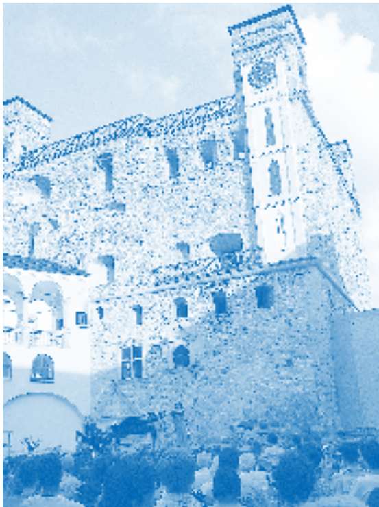
12. Augst 2007: Gala-Konzert im Schloss von Sárospatak – mit Händel-Arien

tragen und sanft diejenigen führen, die Junge haben. (Jesaja 40, 11) Kommt her zu ihm alle, die ihr leidet und schwer beladen seid, und er wird euch Ruhe geben. Nehmt sein Joch auf euch und lernt von ihm, denn er ist sanftmütig und von Herzen demutsvoll, und ihr werdet Ruhe finden für eure Seelen. (Matthäus 11, 28-29) 18. Chor: Sein Joch ist sanft, und seine Last ist leicht. (Matthäus 11,30)