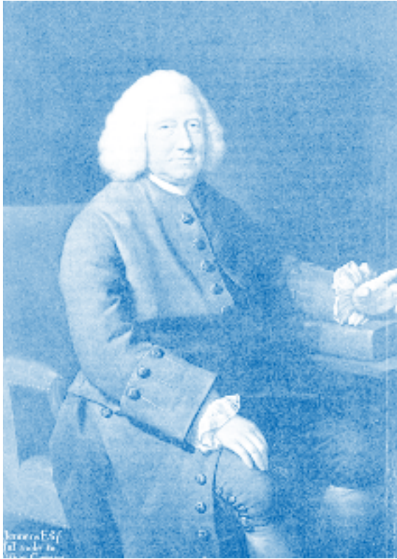
Charles Jennens wrote the libretto of the „Messiah“

se around him also began to see in him the Son of God. Jesus for example reads Isaiah 61 in the synagogue and says „Today this word is fulfilled“. (Luke 4, 18 ff.). Or he does things that, according to Isaiah, the Servant of God is going to do: heal, raise the dead, (Matthew 11, 5), free prisoners (the possessed)...And he dares to do what only God „is allowed“ to do (e.g. forgive sins (Mark 2)).