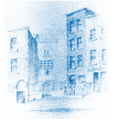
Konzertsaal in Dublin, wo der „Messias“ seine Uraufführung erlebte

39. Chor: Halleluja, denn der Herr, der allmächtige Gott, herrschet. (Offenbarung 19,6) Das Königreich dieser Welt ist zum Königreich unseres Herrn und seines Christus geworden; und er wird regieren auf immer und ewig, (Offenbarung 11,15) König der Könige, Herr der Herren (Offenbarung 19,16), Halleluja.