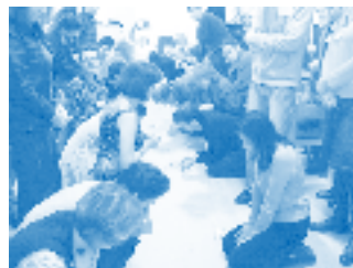
Annual conference: Intercession for colleagues in the music world