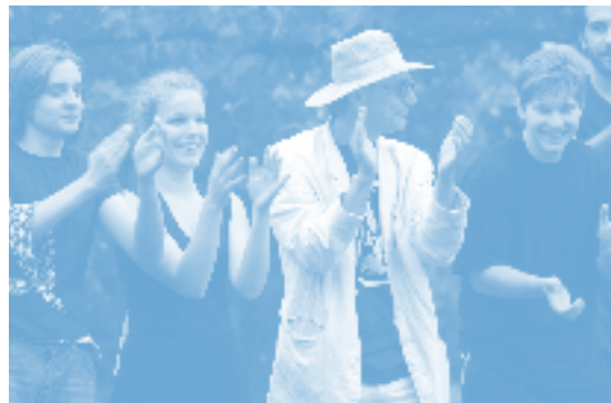
Crescendo Summer Institute of the Arts

C RESCENDO, Postfach 219, CH-4003 Basel. Office: Rehhagstr.14, 4410 Liestal. Phone: +41 61 923 06 84 / Fax: +41 61 923 06 83 / Email: info@crescendo.org R edaktion: Beat Rink (verantw.), Bill Buchanan, Jan Katzschke M itarbeiter an dieser Nummer: Janos Ujhazi Ü bersetzungen: Bill Buchanan G estaltung: Grafik team Campus für Christus, Giessen D ruck: Jordi AG, CH-Belp