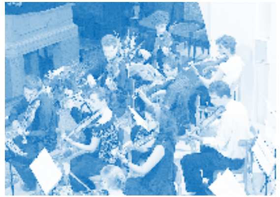
18: Chorus: His yoke is easy, and his burden is light. (Matthew 11: 30)