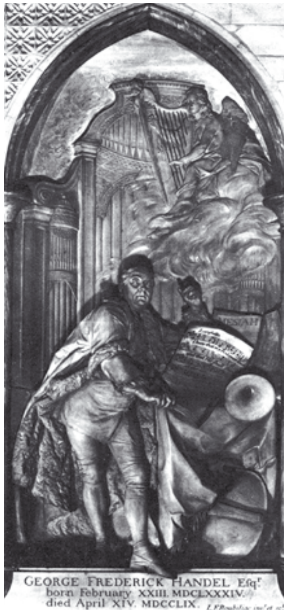
The Handel Memorial in the Westminster Abbey