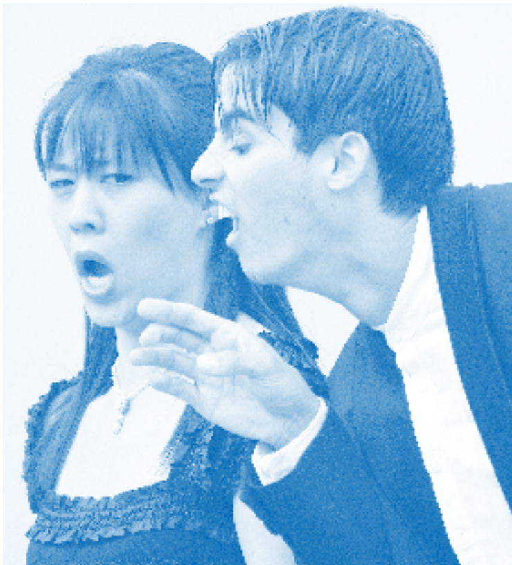
Opera scenes in Sárospatak