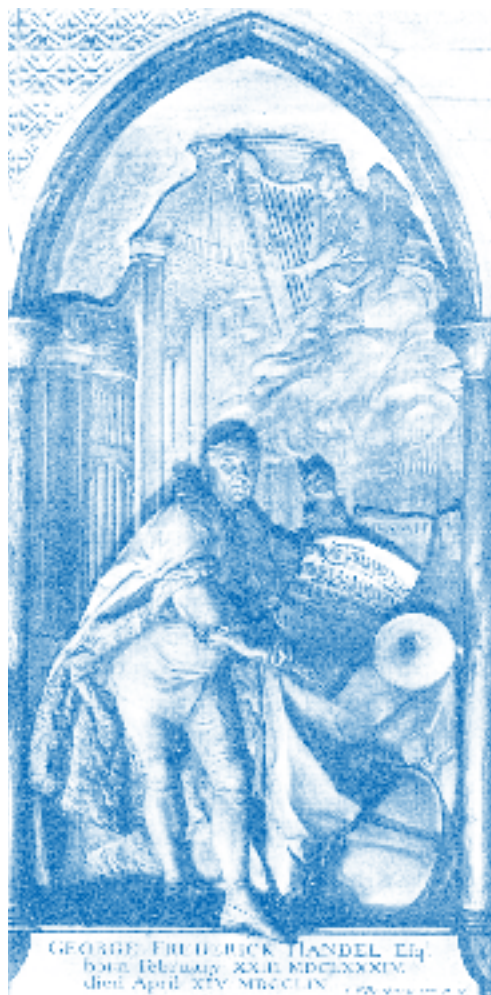
Das Händel-Denkmal von 1761 in der Westminster Abbey

der berühmtesten und besten Psalmdichter war der König David. Die Psalmen wurden zum Teil im Tempel zusammen mit der Gemeinde gesungen. Die Musik der Psalmen ist leider nicht überliefert. Aber die Verse selbst sind Weltliteratur und haben zahlreiche Dichtungen und natürlich auch Komponisten inspiriert. Die Psalmen sind im Vergleich mit den Worten des Jesaja und anderer Propheten, die den Messias und sein Wirken deutlich „voraussahen“, nicht so stark prophetisch. Aber die Psalmen-Dichter wussten, wie Gott im Volk und im Leben des einzelnen Menschen handelt. Viele Psalmen handeln von Gottes früheren Taten. Darum konnte David singen: „Du wirst mich nicht dem Tod überlassen.“ (Psalm 24, 7-10) Weil die Psalmsänger wissen, wer Gott ist und wie in der Vergangenheit gehandelt hat, können sie auch sagen, wie er in der Zukunft handeln wird. Darum haben die Psalmen eine gewisse prophetische Qualität und sind von zeitloser Aktualität!