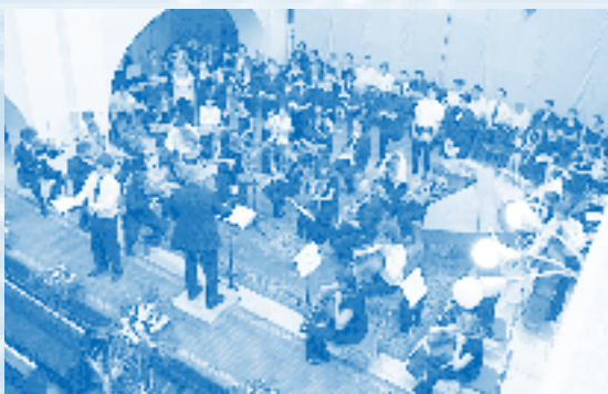
„Messiah“ performance in the „Crescendo Summer Institut of the Art“ in Hungary

part (the soprano) introduces the theme but then comes only a second part (the tenor) while we're expecting the entry of all four parts one after the other following the rules of polyphony. Moreover, above the theme sung by the second part (the tenor) the soprano gives only a simple though virtuoso ornamentation. The reduction of the number of parts and the light, airy counter-theme (actually pure ornamentation) result in a transparent, easily acceptable sound. The main musical goal becomes obvious later when after an expansion, now with all four parts we hear the words: „Wonderful, Counsellor...“. Here Handel feels like at home: in big homophonic blocks the words sound like manifestation.