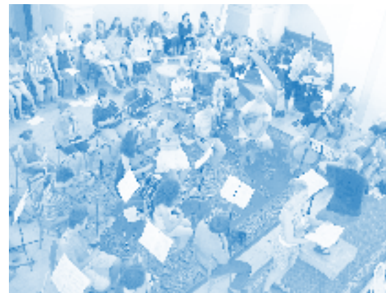
In Hungary the orchestra musicians and the singers were mostly students of the Crescendo-Institut

40. Air (Soprano): I know that my Redeemer liveth, and that he shall stand at the latter day upon the earth. And though worms destroy this body, yet in my flesh shall I see God. (Job 19: 25-26). For now is Christ risen from the dead, the first fruits of them that sleep. (I Corinthians 15: 20).